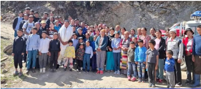
Unsere Nepal-Children-Familien grüssen herzlich aus Hewa, Chhulemo, Deku, Akang, Nunthala, Chhaga, Phuleli, Oluma, Ludu, Tabuk, Ringmu, Chie.