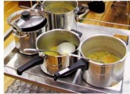
Fastensuppe Unsere traditionelle Fastensuppe findet an folgenden Terminen im Februar statt: 22. und 29. Februar 2024, jeweils um 12.00 Uhr im Pfarreisaal.